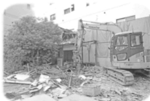
②2013年3月27日 解体工事開始