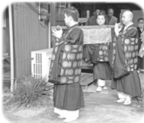
①2012年12月6日 御本尊動座式 (御本尊のお引越し 比治山町法正寺へ)