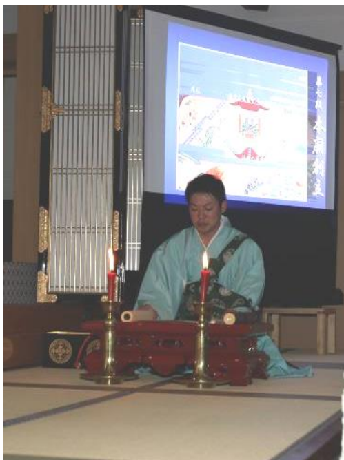
御伝鈔の拝読に併せて、御絵伝の場面が映しだされました。